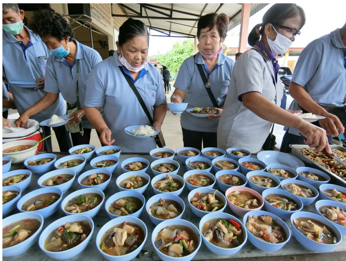
รับประทานอาหารกลางวันร่วมกัน