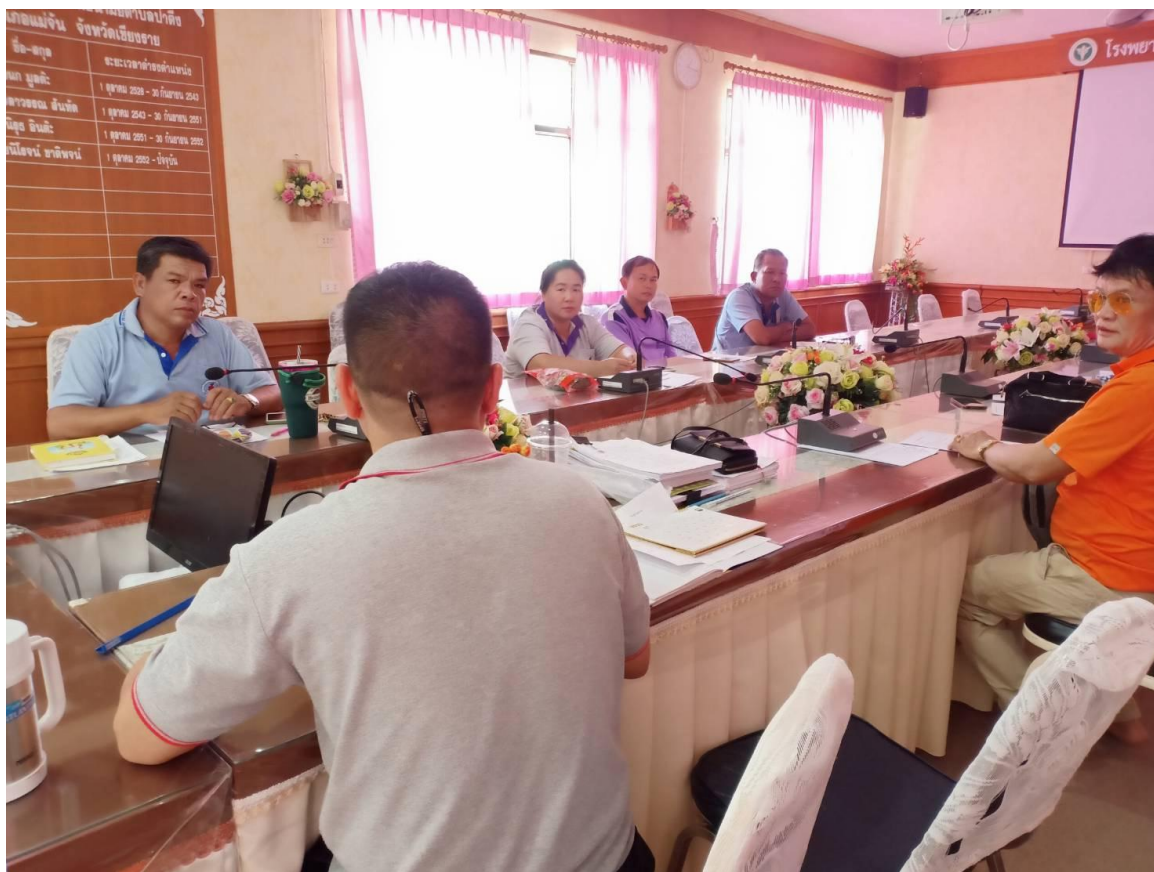
ประชุมคณะกรรมการ