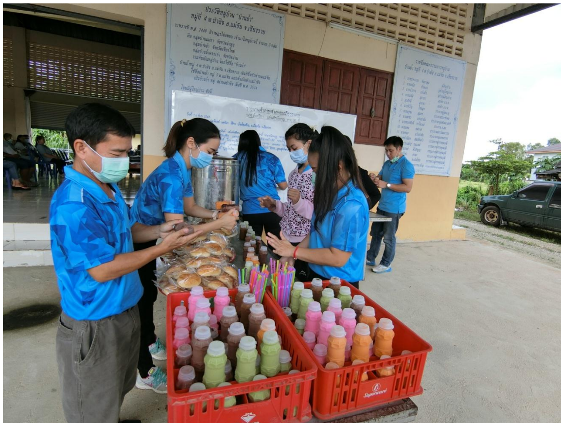
อาหารว่าง