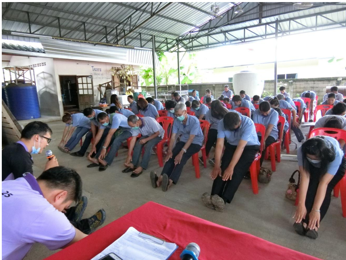
การบริหาร