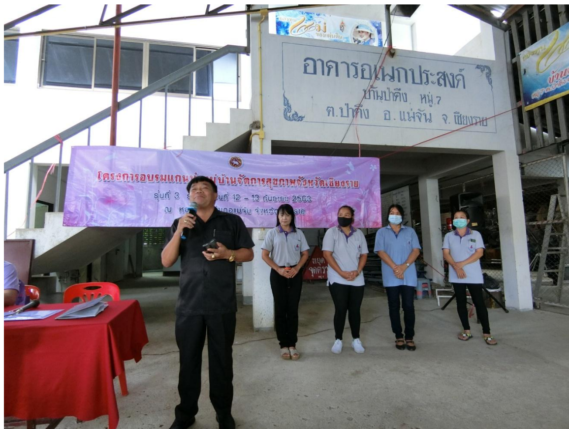
เวทีแลกเปลี่ยนเรียนรู้