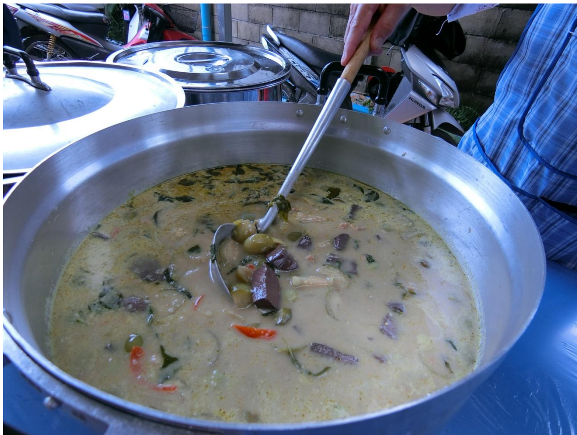
อาหารกลางวัน