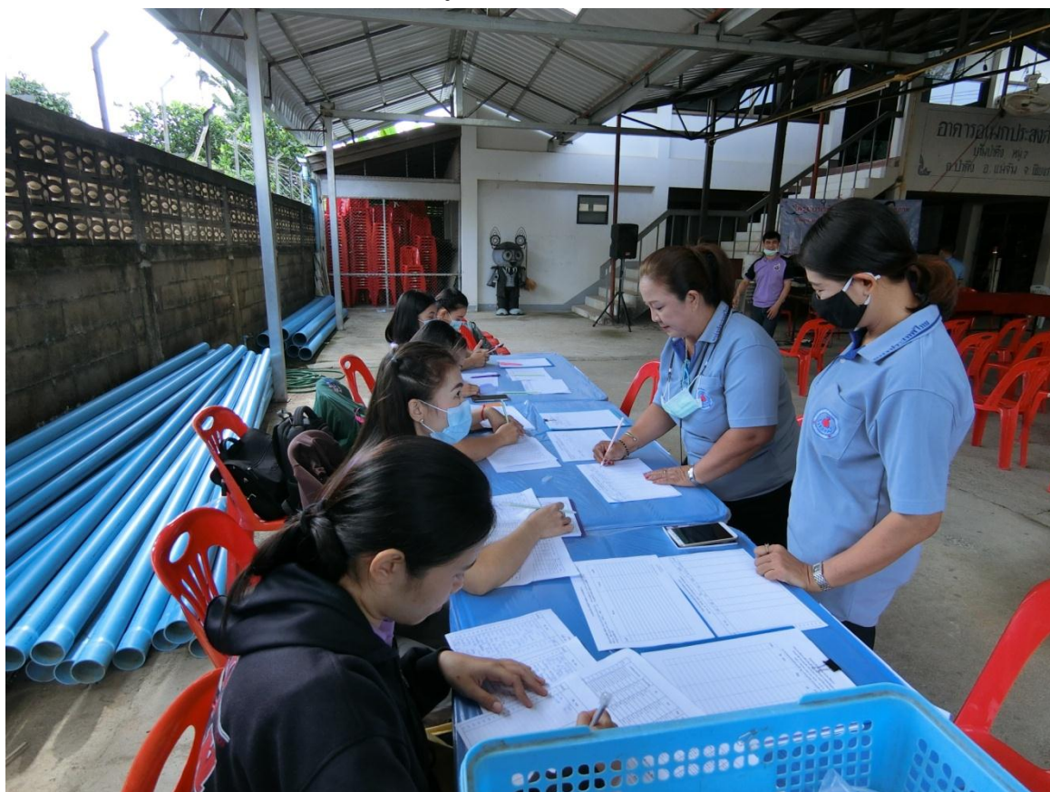
ลงทะเบียนเข้าร่วมกิจกรรม