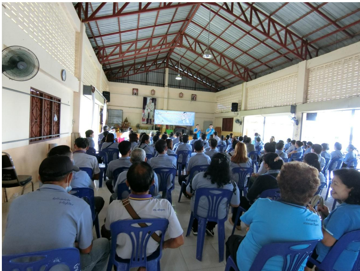
ผู้เข้าร่วมกิจกรรม