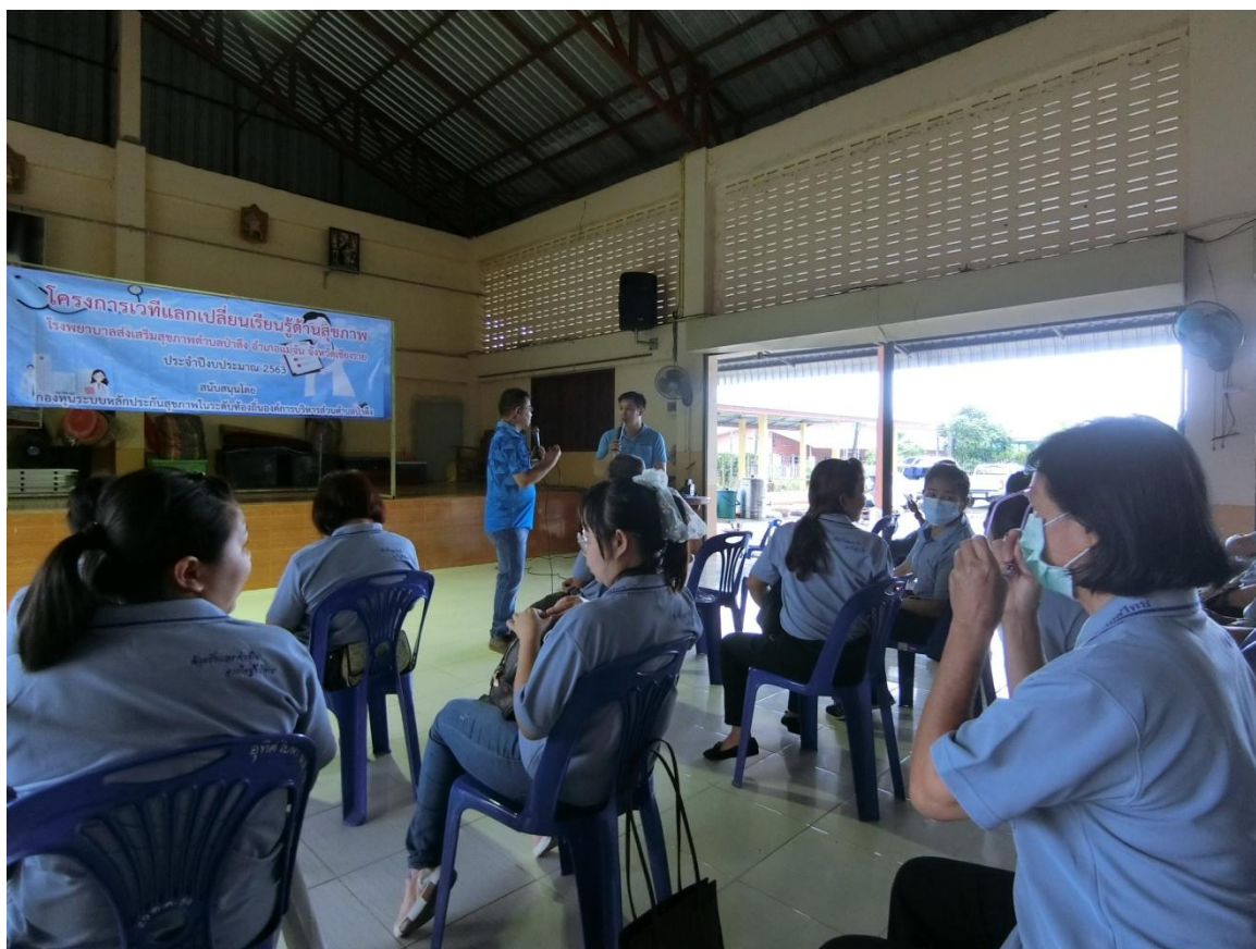
เวทีแลกเปลี่ยนเรียนรู้บ้านป่าบาง หมู่ 1 และบ้านป่าบาง หมู่ 2