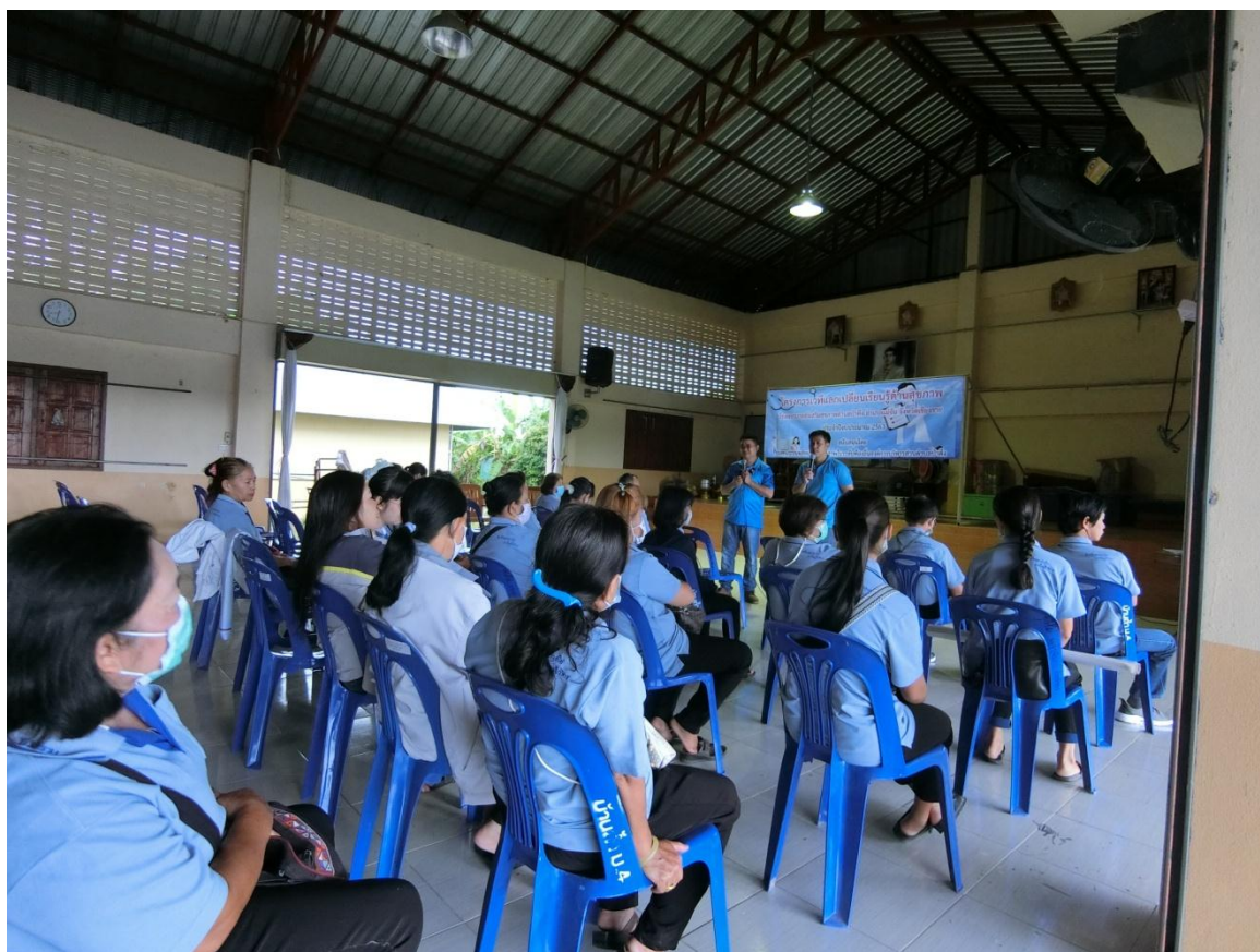
กิจกรรมเวทีแลกเปลี่ยนเรียนรู้ด้านสุขภาพ