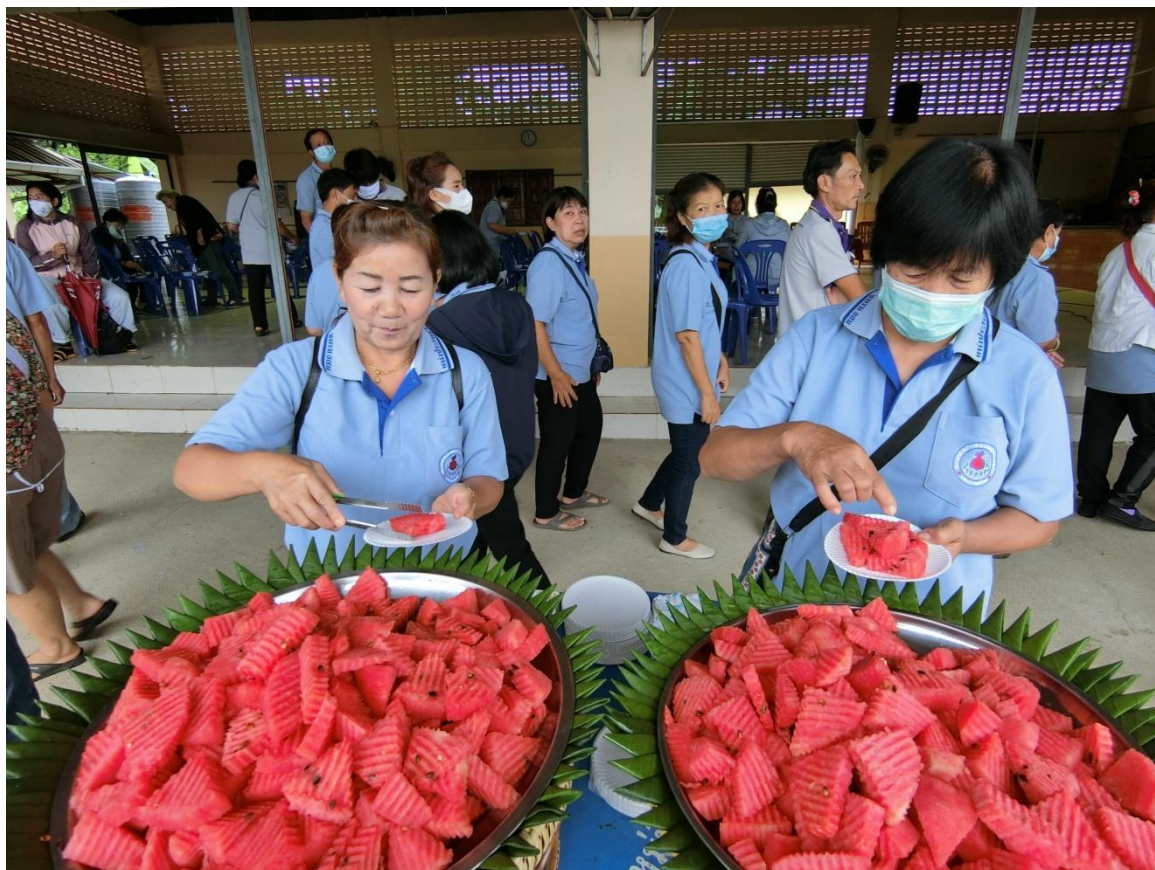
อาหารว่าง