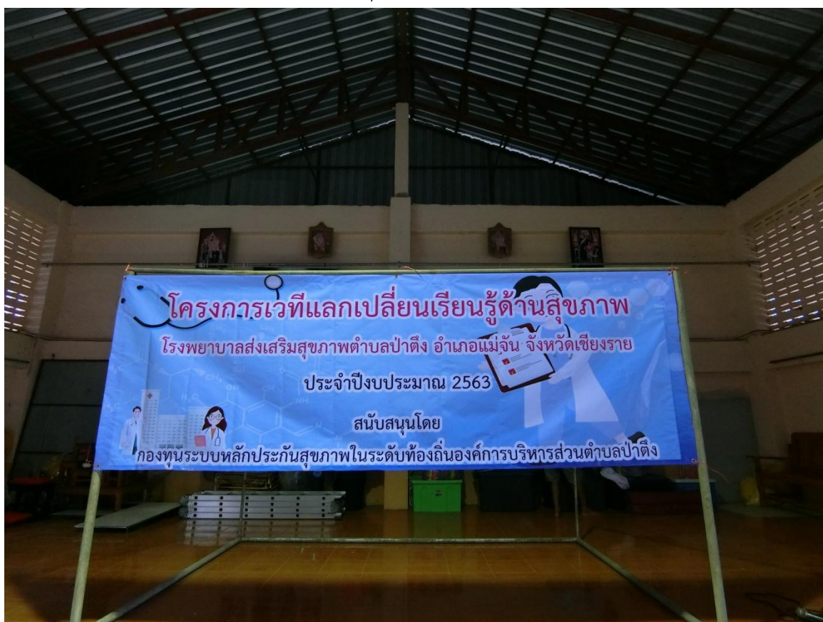
การจัดกิจกรรมเวทีแลกเปลี่ยน