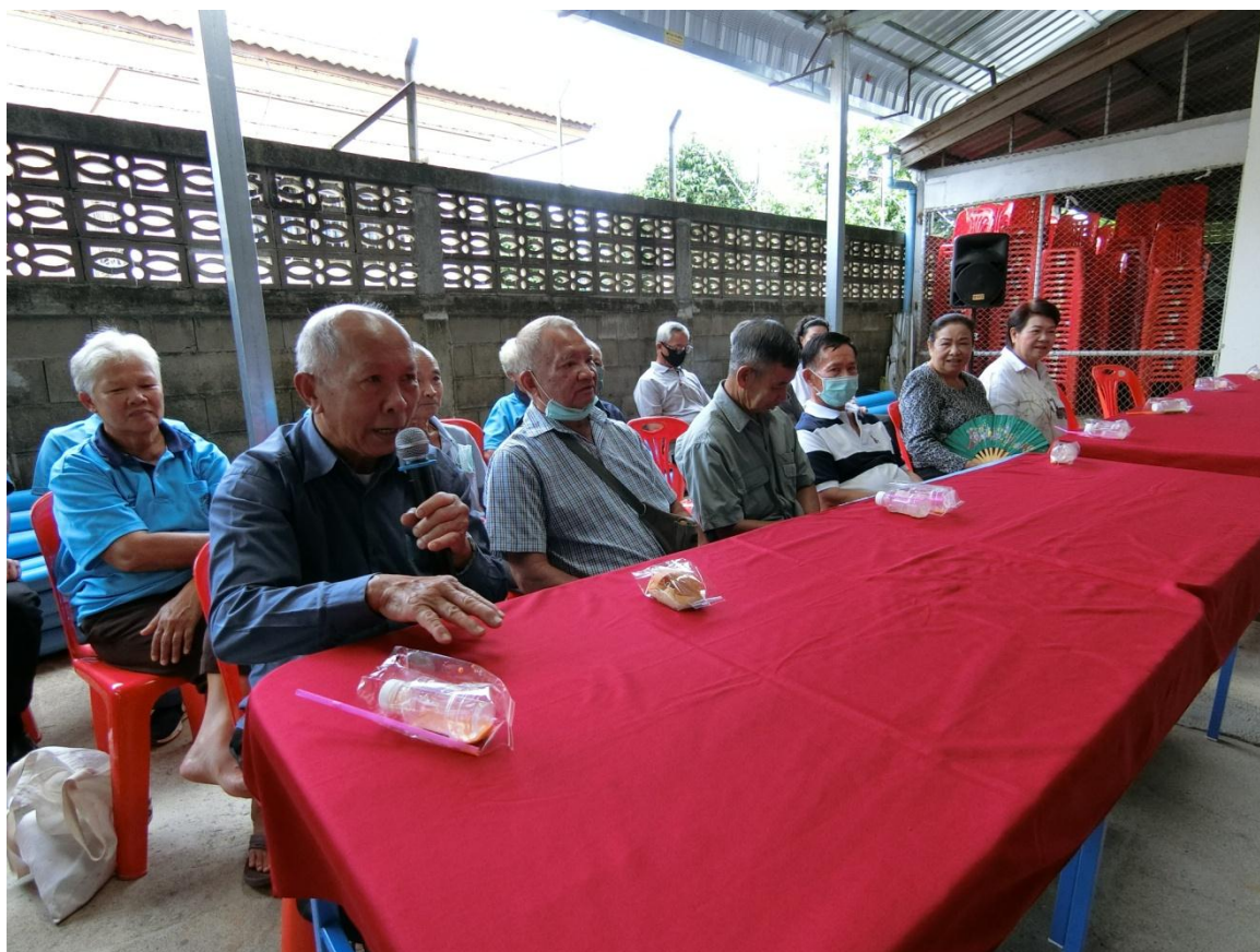
ภาคีเครือข่ายในชุมชนร่วมแลกเปลี่ยน