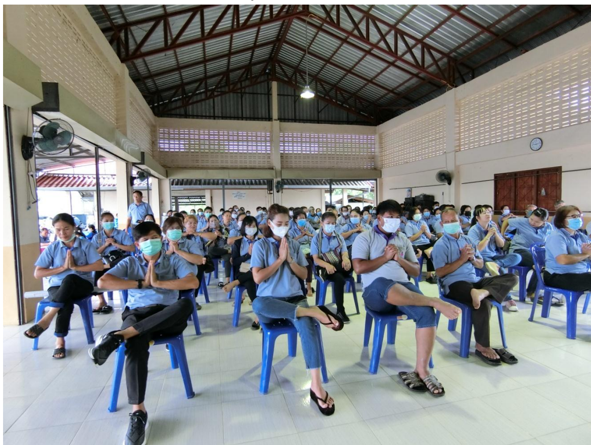
กายบริหารก่อนการทำกิจกรรม