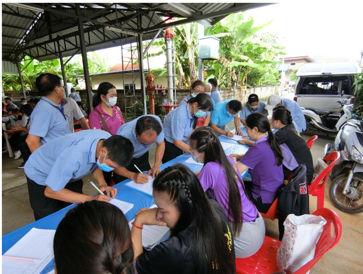
กิจกรรมเวทีแลกเปลี่ยนเรียนรู้ ครั้งที่ 4