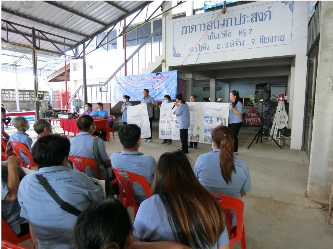
เวทีแลกเปลี่ยนเรียนรู้