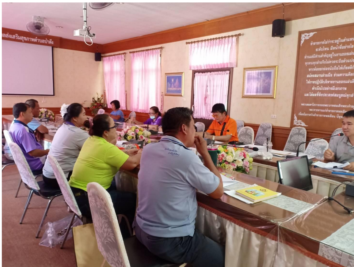
ประชุมคณะดำเนินงาน และผู้เกี่ยวข้อง