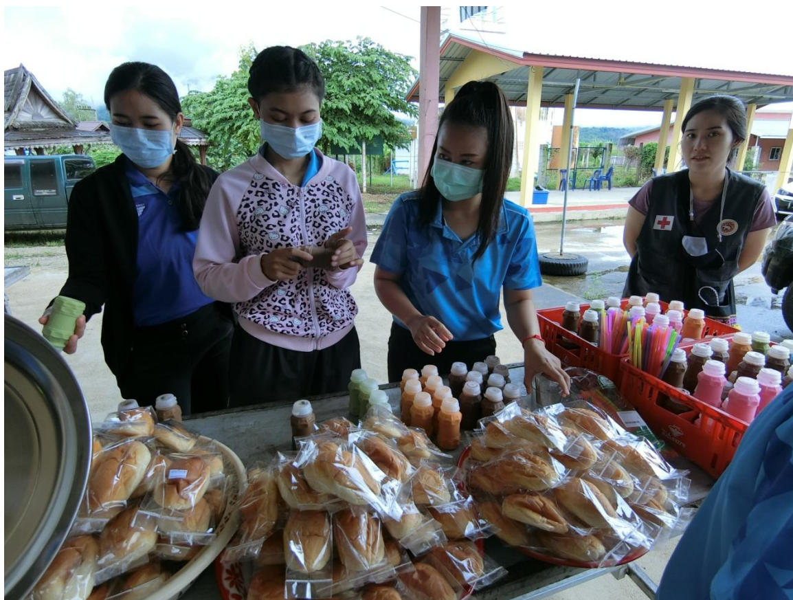
อาหารว่าง