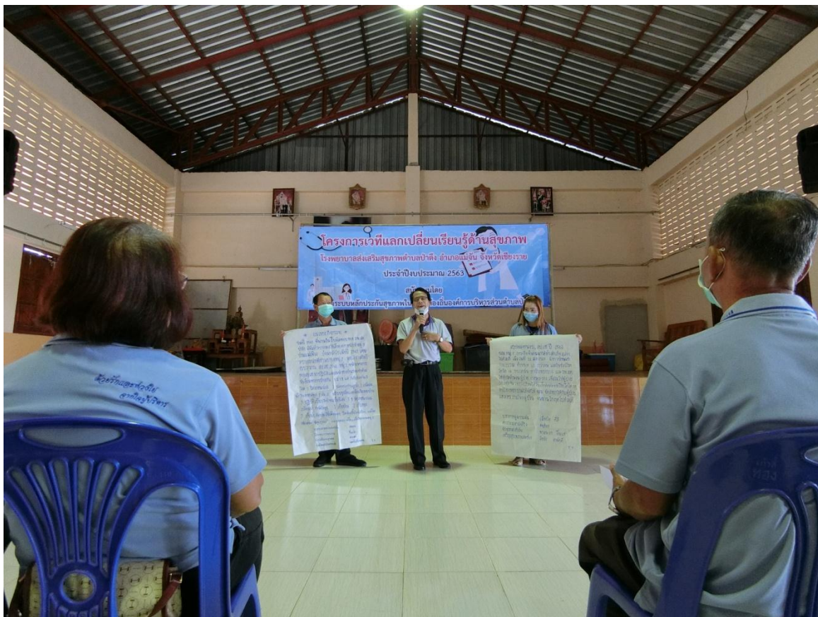
การนำเสนอผลการดำเนินงานของแต่ละหมู่บ้าน