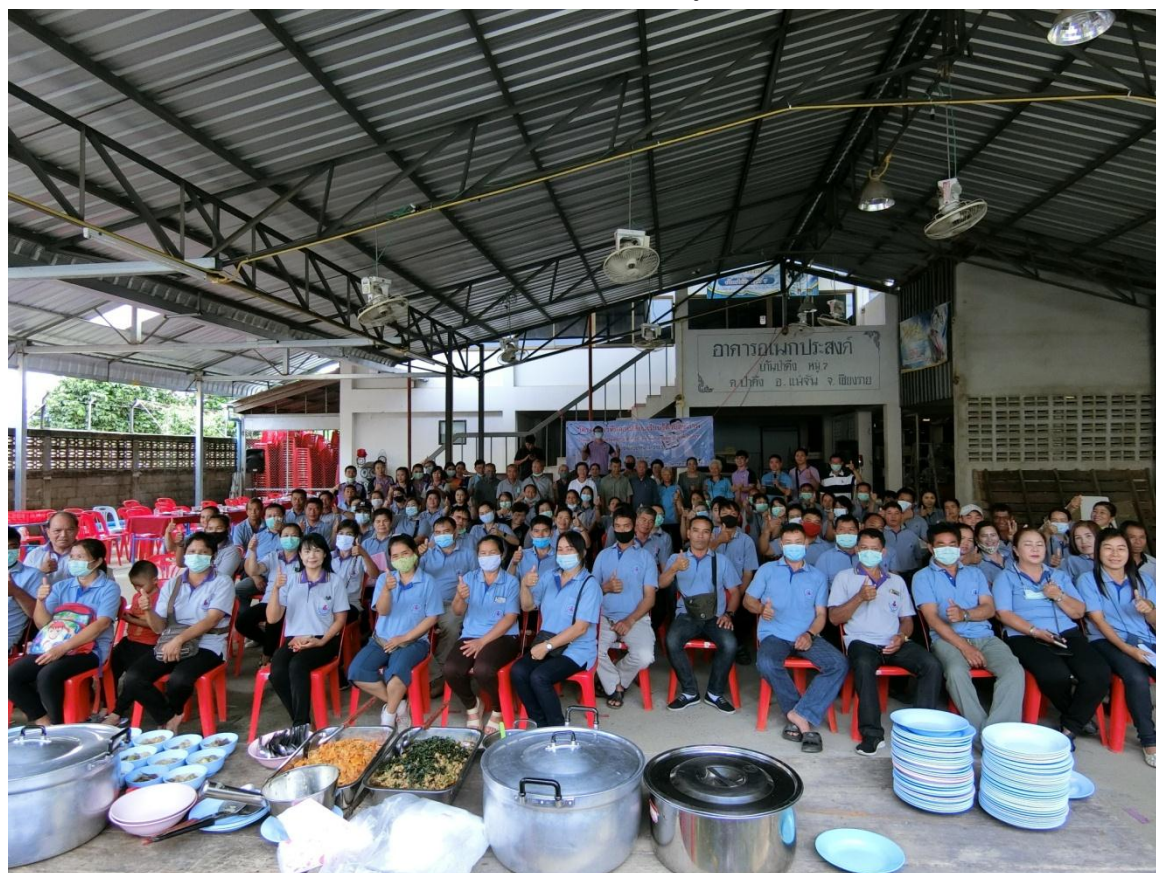
ถ่ายภาพร่วมกัน