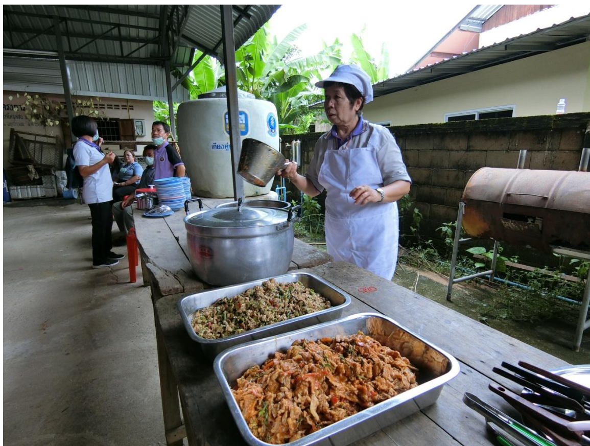
อาหารกลางวัน