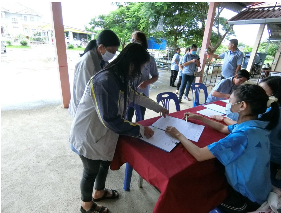
ลงทะเบียนผู้เข้าร่วมกิจกรรม