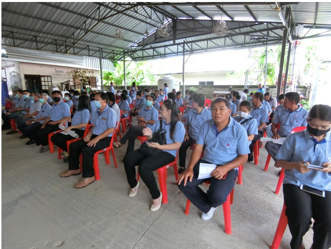
ผู้เข้าร่วมกิจกรรม