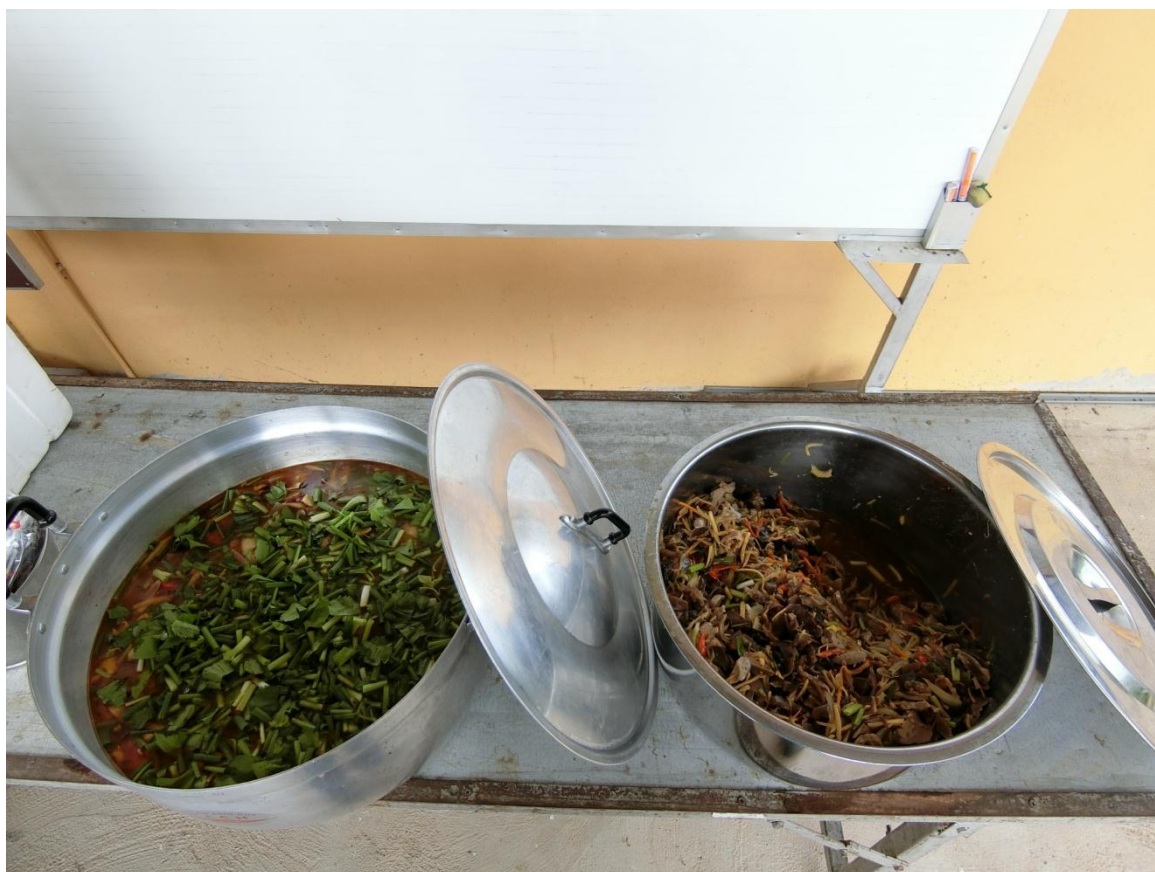
อาหารกลางวัน