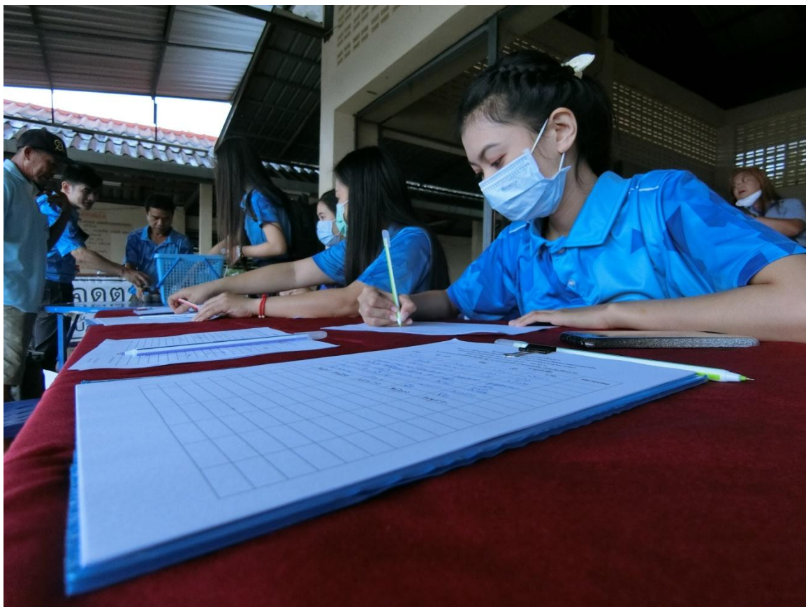
ลงทะเบียน