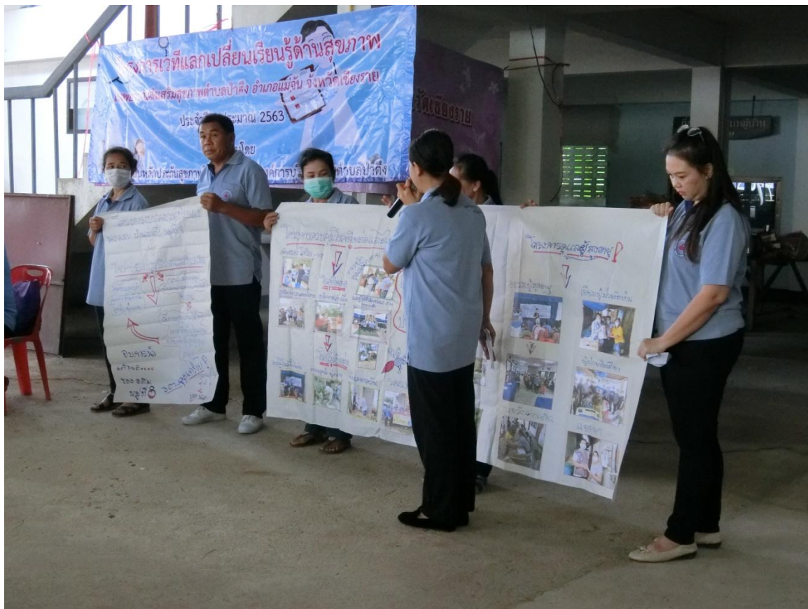
การนำเสนอแลกเปลี่ยนเรียนรู้