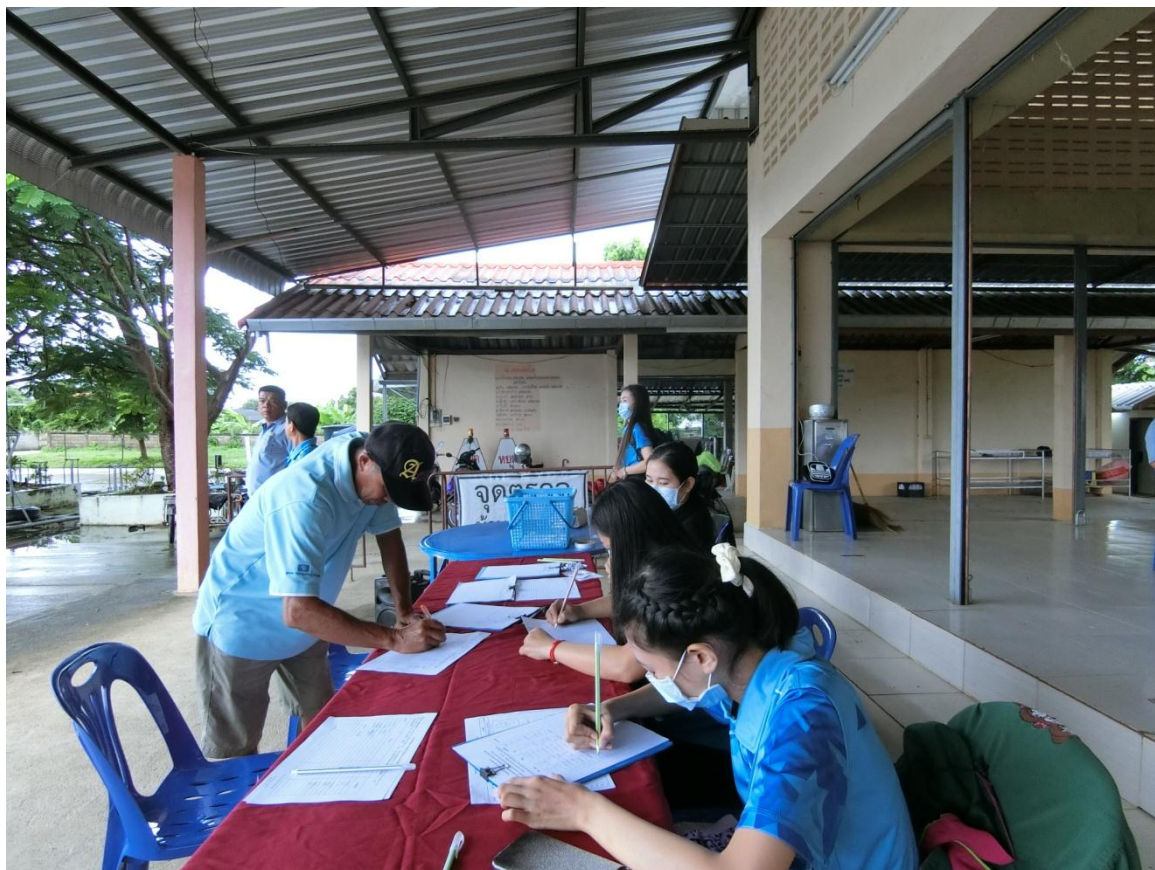
ลงทะเบียนเข้าร่วมโครงการ