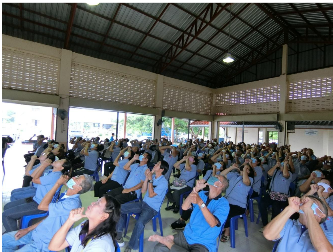
กิจกรรมการบริหาร