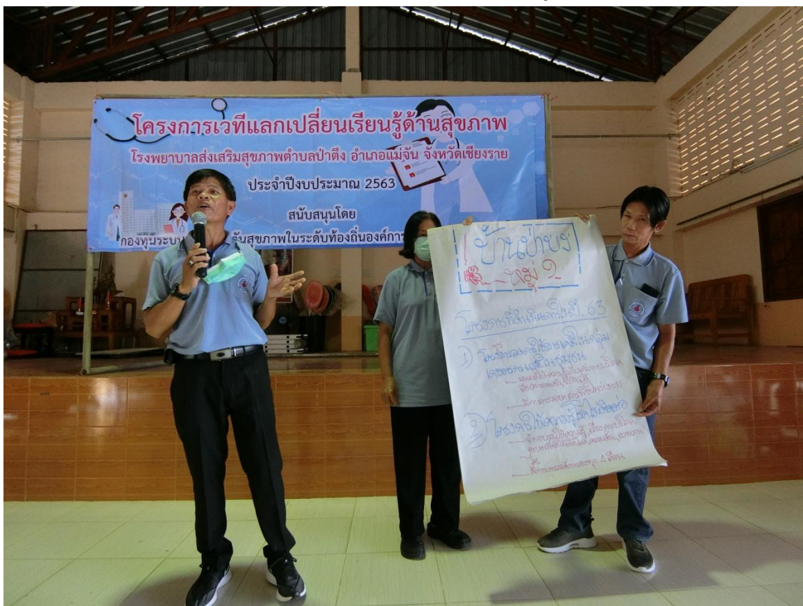
การนำเสนอผลการดำเนินงาน และกิจกรรมที่คาดหวังจะดำเนินการในปีงบประมาณ 2564