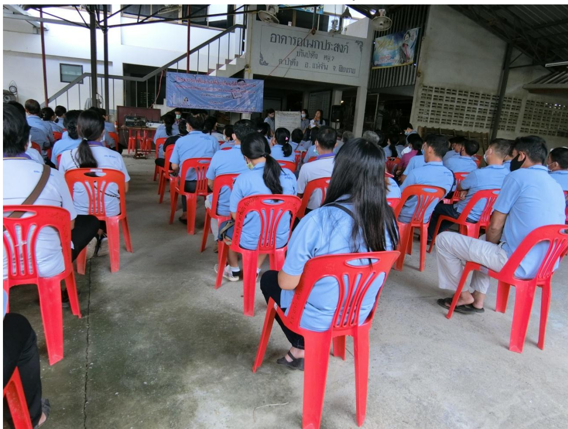
ผู้เข้าร่วมกิจกรรม