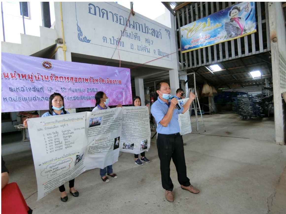
เวทีแลกเปลี่ยนเรียนรู้