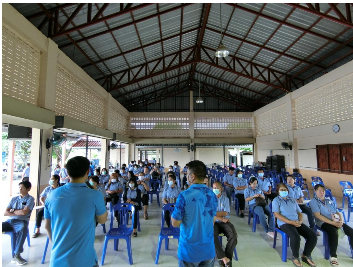
เวทีแลกเปลี่ยนเรียนรู้ด้านสุขภาพ