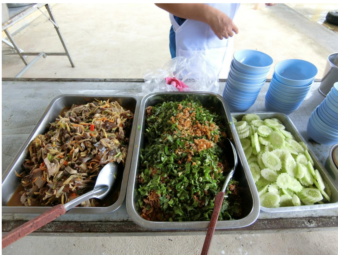
อาหารกลางวัน