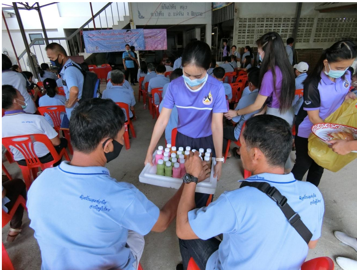
อาหารว่าง