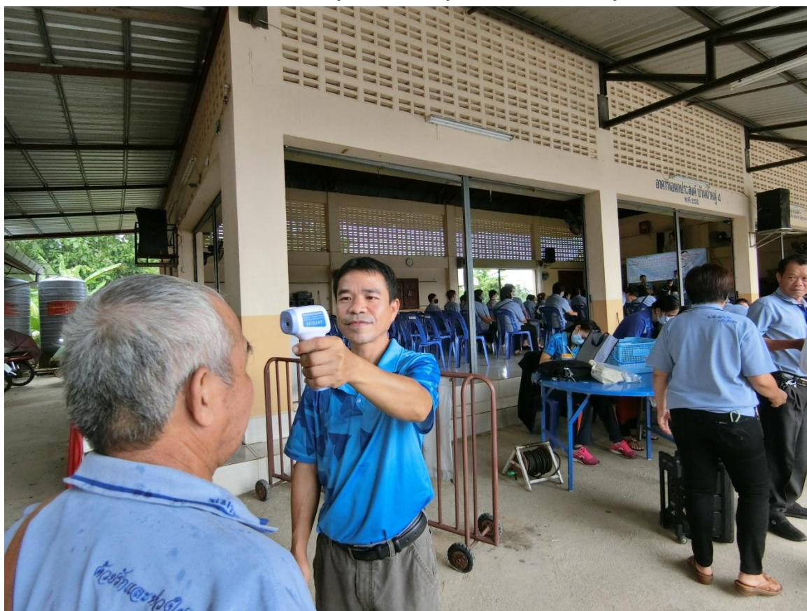
การปฏิบัติตามมาตรการป้องกันโรค Covid - 19