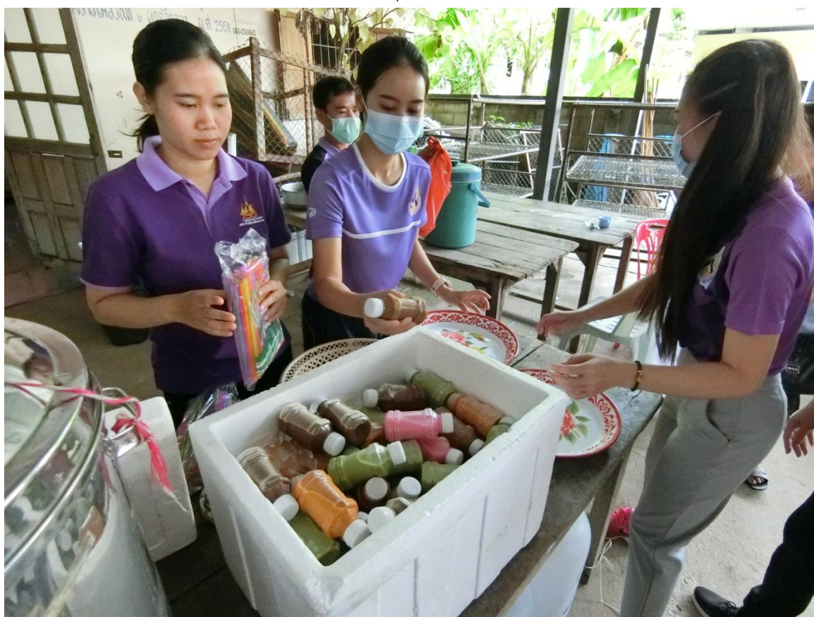
อาหารว่าง