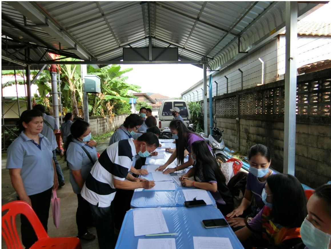
ครั้งที่ 5