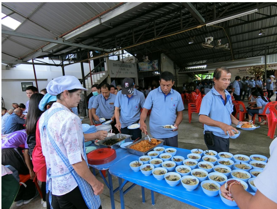
รับประทานอาหารกลางวันร่วมกัน