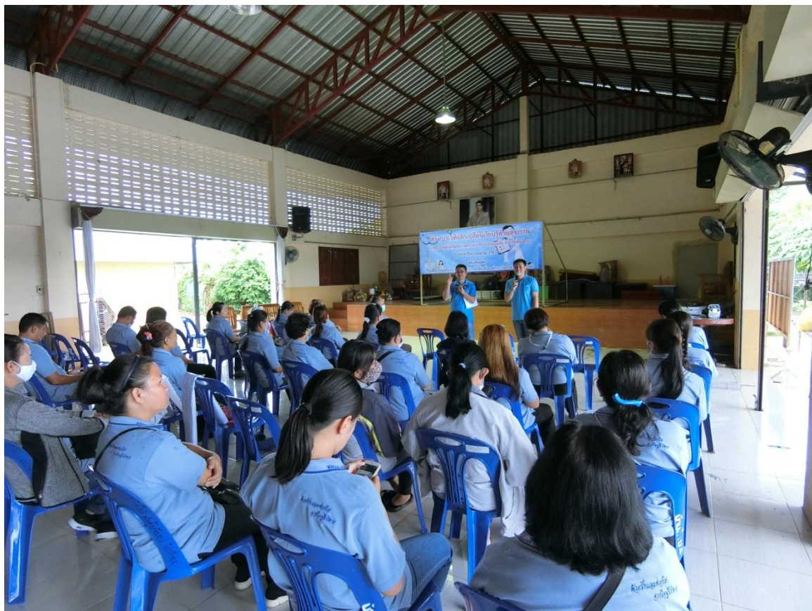
เวทีแลกเปลี่ยนเรียนรู้ด้านสุขภาพ