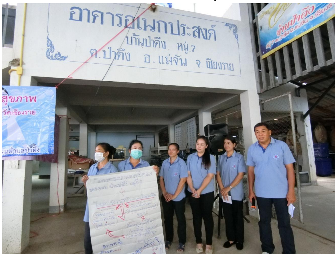
นำเสนอแลกเปลี่ยนเรียนรู้