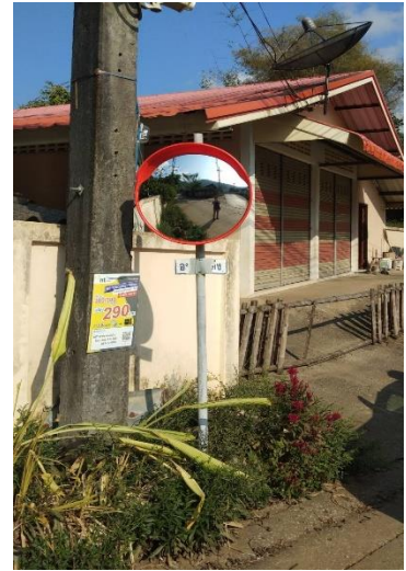
๓.จุดที่ ๖๓ สามแยกหน้าโรงเรียนบ้านปางสา หมู่ที่ ๑๗