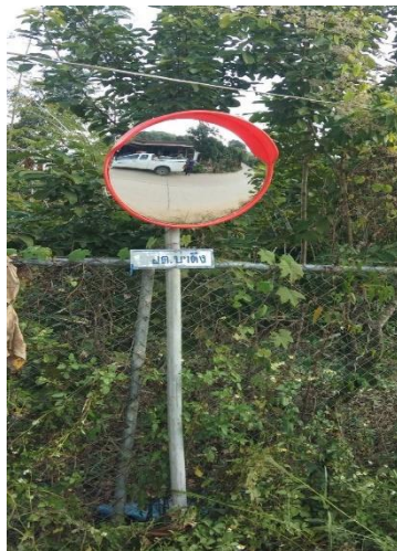
๕.จุดที่ ๘๖ ทางขึ้นซอย ๖ หมู่ที่ ๒๐