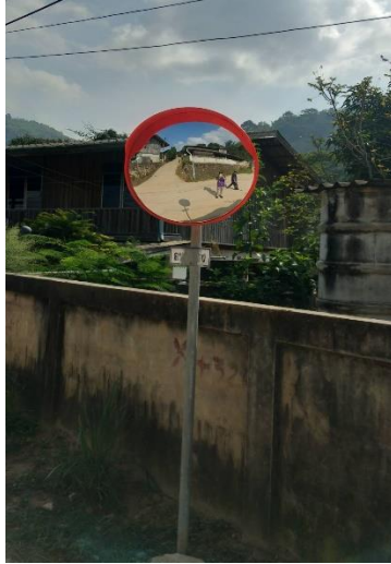
๒.จุดที่ ๖๑ ทางแยกซอย ๓ บ้านห้วยต่าง (จะพือ) หมู่ที่ ๑๖