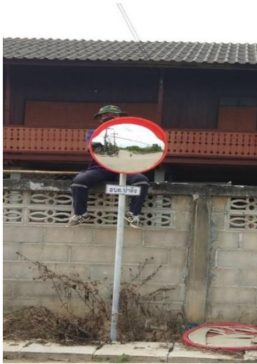
๑.จุดที่ ๑๙ สามแยกไปบ้านแม่เฟือง - บ้านผาดั้ง หมู่ที่ ๖