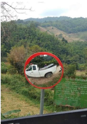
๗.จุดที่ ๖๗ โค้งทางขึ้นบ้านจะตะ หมู่ที่ ๑๗