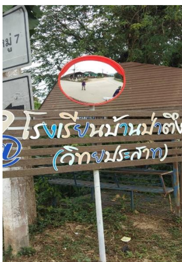
๘.จุดที่ ๒๒ สะพานแยกเข้าวัด / โรงเรียนบ้านป่าตึง หมู่ที่ ๗