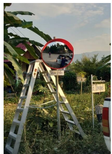
๙.จุดที่ ๓๒ หน้าวัดบ้านสันโค้ง หมู่ที่ ๑๐