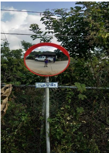
๔.จุดที่ ๕๙ โค้งในหมู่บ้านเล่าซีก้วย หมู่ ๑๖