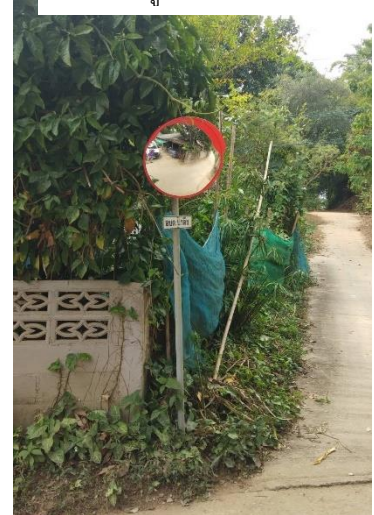
๖.จุดที่ ๓๙ แยกบ้านนายดนนัยวัฒน์ ซอย ๕ หมู่ที่ ๑๒