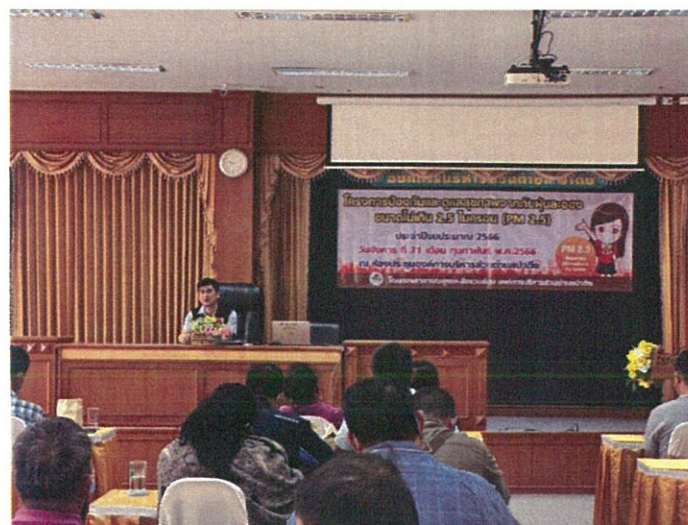
วิทยากรบรรยายให้ความรู้เกี่ยวกับการป้องกันและแก้ไขปัญหามลพิษทางอากาศฝุ่นละอองขนาดเล็ก ที่ส่งผลกระทบต่อสุขภาพ