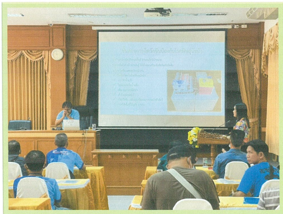
วิทยากรบรรยายให้ความรู้และสาธิตวิธีการฉีดวัคซีนป้องกันโรคพิษสุนัขบ้า