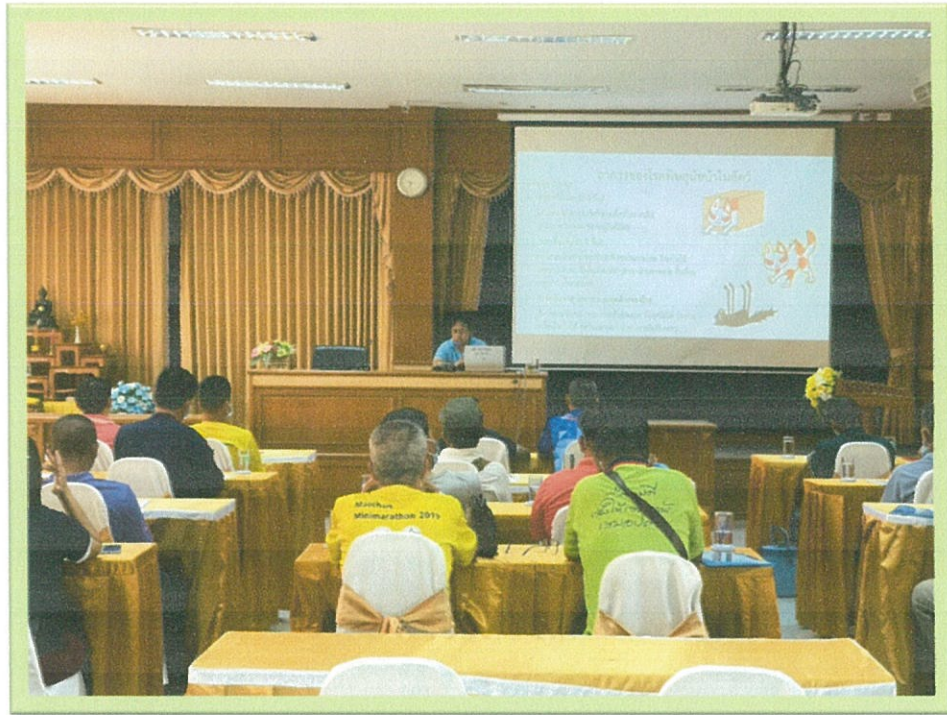
วิทยากรบรรยายให้ความรู้เกี่ยวกับการป้องกันโรคพิษสุนัขบ้า