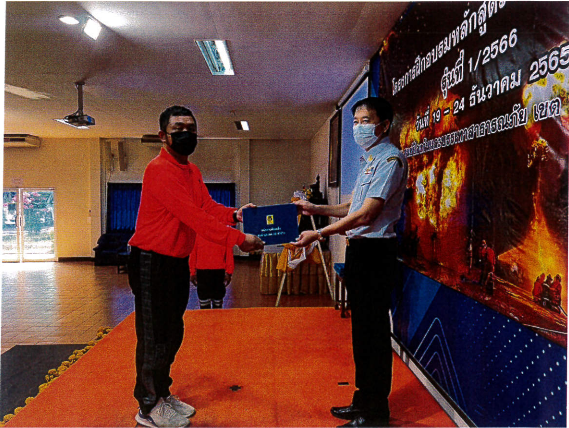
รูปภาพระหว่างมอบรางวัลโครงการหลักสูตรพนักงานดับเพลิงรุ่นที่ ๑/๒๕๖๖